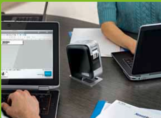
Bezdrátové sdílení tiskárny