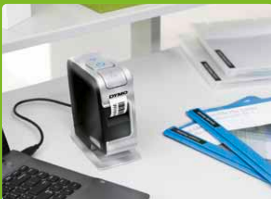
Připojení k počítači

S funkcí Plug and Play není třeba instalovat žádný software